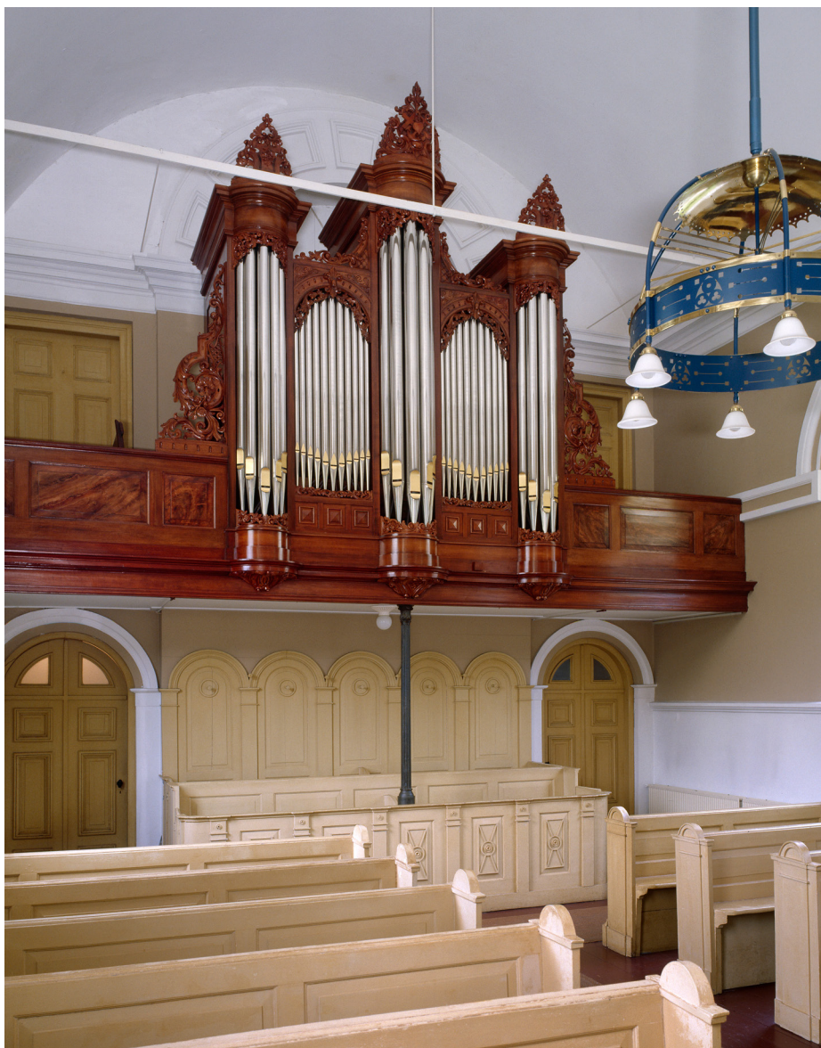
Het interieur van de Terbandsterskerke in het Friese Terband is een goed voorbeeld van een ingetogen protestants waterstaatsinterieur.

kansel of voorname herenbanken van adellijke families. In de kerken van na de Franse tijd – toen stelling werd genomen tegen de heersende klasse – komen de herenbanken niet meer voor.