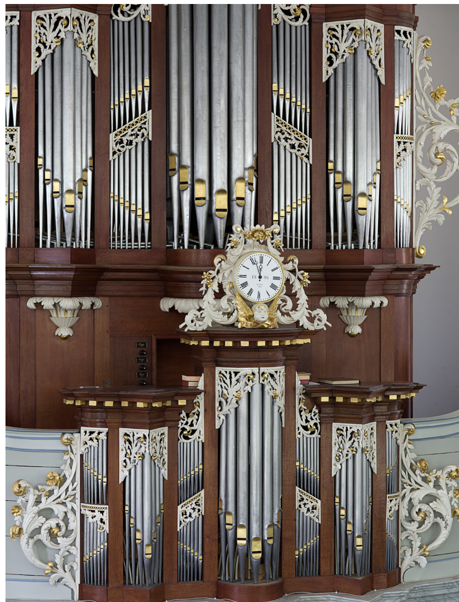
De interieurs van protestantse waterstaatskerken zijn over het algemeen sober. Uitbundigheid kan vaak wel gevonden worden in het sierlijke, goud geschilderde houtsnijwerk van de orgels, zoals in het orgel in de Koepelkerk in Veenhuizen.