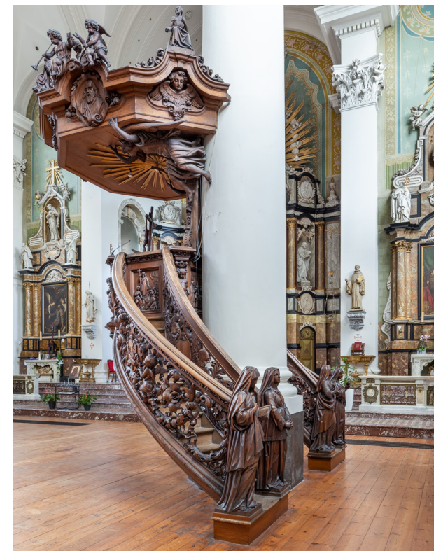
Rijk gesneden houten preekstoel tegen een zuidelijke pijler van het schip van de kerk. Het meubel werd gemaakt door de Vlaming Jan-Baptist De Cuyper. Op de kuip bevinden zich reliëfs met franciscaner symboliek. Elk van de twee trappen wordt 'bewaakt' door twee deugden.