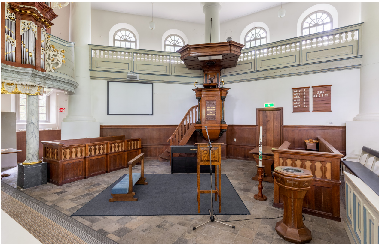
De preekstoel is geplaatst in één van de acht hoeken van het gebouw. Aan weerszijden van de preekstoel staan onbeschilderde houten kerkenraadsbanken.