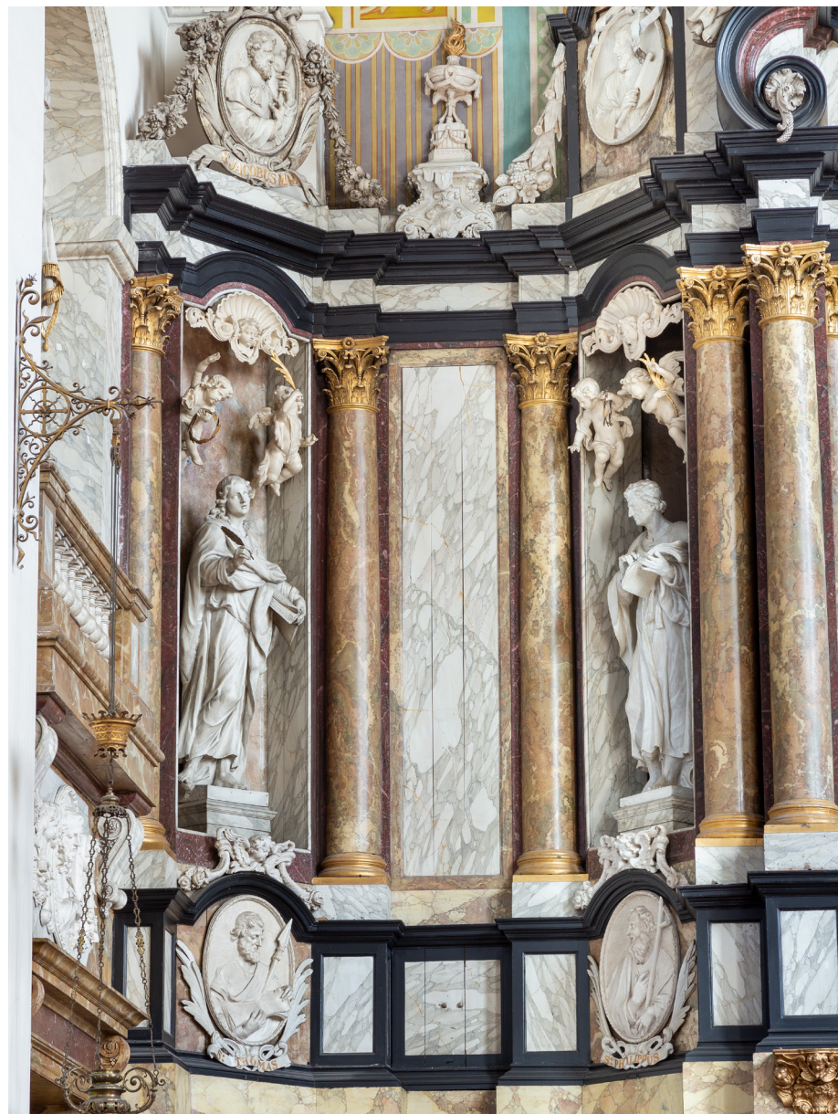
Rooms-katholieke waterstaatskerken hebben vaak een uitbundig altaar met zuilen, schilderijen en beelden. Het hoofdaltaar van de Mozes en Aäronkerk in Amsterdam (detail) heeft beelden van evangelisten en medaillons met apostelen. Ze zijn wit geschilderd zodat het marmeren beelden lijken.

Tot omstreeks 1850, als de neogotiek belangrijker wordt, is dit voor katholieken het vertrouwde kerkinterieur. Zulke ensembles getuigen van een inhaalslag na de schuilkerkenperiode. Ze boden de gelegenheid om te voelen wat in katholieke landen als België al eeuwen heel gewoon was: de triomfantelijke geest van de Contrareformatie, zoals verbeeld door barokkunstenaars als Peter Paul Rubens. Ook de schuilkerken waren barok ingericht, maar een stuk bescheidener. De grotere waterstaatskerken boden de gelegenheid om nu eindelijk eens ‘flink uit