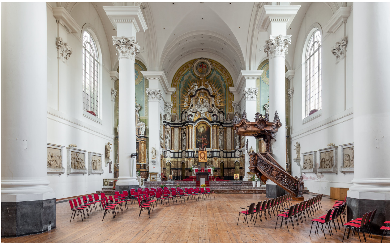
Zicht op het interieur richting het koor. Het interieur wordt gekenmerkt door hoge zuilen en pilasters, rondboogvensters en een kleurrijk, uitbundig hoofdaltaar.

En dan dat orgel. Het dateert uit 1871 en is dus van na de waterstaatsperiode. Het werd echter in overeenstemming met het bestaande interieur in neobarokke stijl vormgegeven. Op de orgelkast bevinden zich darterle engeltjes en ander decoratief snijwerk. Men kan zich voorstellen hoe de voorname reputatie die koor en orgel van de Mozes en Aäronkerk hadden, het interieur een extra dimensie gaf.