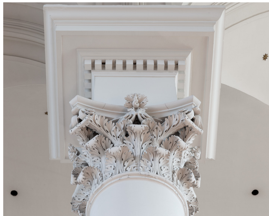
Waterstaatsingenieurs werden vrij gelaten in hun stijlkeus. Toch zijn veel waterstaatskerken in neoclassicistische stijl uitgevoerd. Zuilen met kapitelen domineren de interieurs, zoals dat van de Mozes en Aäronkerk in Amsterdam.

was belangrijk om de hoogte van de subsidies te berekenen. De ingenieurs van het Ministerie van Waterstaat en de ambtenaren van Eredienst vulden elkaar daarbij aan. Vandaar het eerder genoemde Koninklijk Besluit van 1824. Dat regelde de subsidies, de bouwkundige check en het toezicht op de timmerlieden en bouwkundigen die de gebouwen ontwierpen. Het is echter een misverstand dat alle nieuw te bouwen kerken door het Ministerie van Waterstaat werden beoordeeld. Uit bronnenonderzoek blijkt dat bemoeienis van dit ministerie niet altijd nodig was. 3 Formeel gaat het alleen om een waterstaatskerk als een waterstaatsingenieur zich met het werk heeft bemoeid. Dat neemt niet weg dat gewoonlijk alle neoclassicistische kerken uit de negentiende eeuw als waterstaatskerk worden aangeduid. Een misverstand dus.