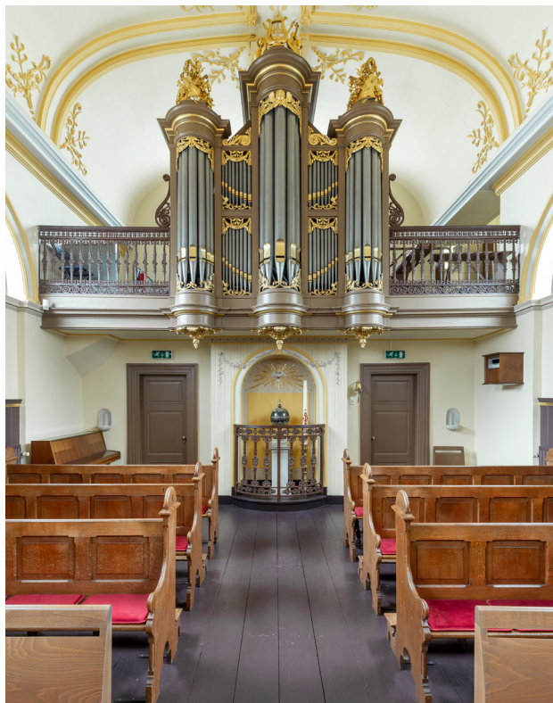
Zicht op het neobarokke orgel met balustrade uit 1843. Het orgel wordt gesierd door verguld snijwerk. Eronder is de doopkapel met het doopvont uit diezelfde periode te zien.

de achttiende eeuw. Het altaar met tabernakel is afkomstig uit de opgeheven oudkatholieke kerk in Delfshaven. De preekstoel komt uit de kerk van Maria Minor in Dordrecht. 9 Nieuwgemaakt zijn de orgelkast en de doopvont, beide uit 1843. Drie pijpentorens met verguld snijwerk domineren het orgelfront. De doopvont is uitgevoerd als een klassieke vaas. Verder valt het rijkversierde plafond op. Het is een gestuct plafond met kooflijsten en in vakken verdeelde