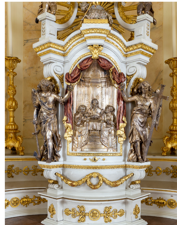
Tabernakel op het hoofdaltaar, bestaande uit beschilderd eikenhout met bladgoud en bladzilver. Twee engelen openen de uit hout gesneden gordijnen en tonen de centrale voorstelling van Christus aan de maaltijd met de Emmaüsgangers.

in Utrecht. Ze zijn zeventiende-eeuws en worden toegeschreven aan de Antwerpenaar Artus Quellinus (1609-1668). Zoals het hoort zijn ze witgeschilderd, met vergulde details. Net als in andere kerken van de oudkatholieken laten ze zien hoe de interieurstukken van de schuilkerken in de latere kerken een belangrijke plek kregen. Modernisering van de interieurs bleef achterwege en ook nu nog hechten de oudkatholieken veel waarde aan de oude stukken.