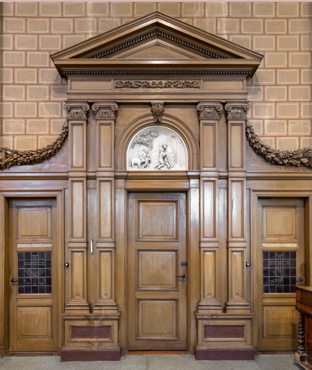
De biechtstoelen van de Josephkerk in Haarlem hebben een klassiek tempelfront met pilasters, kapitelen, timpanen en guirlandes. De rondboogvormige reliëfs verbeelden twee vertellingen uit het verhaal van de Verloren zoon.