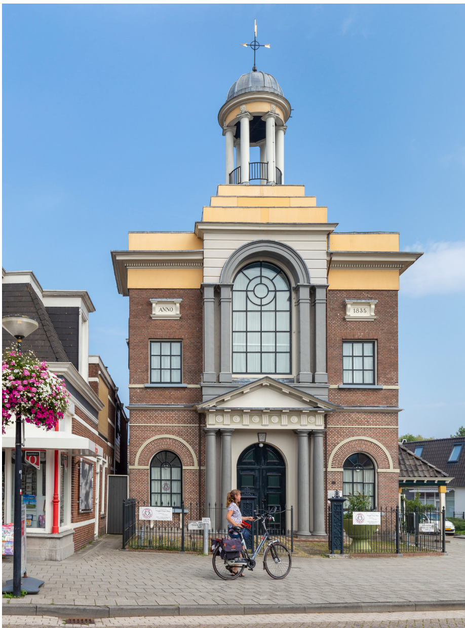
De neoclassicistische stijl met rondbogen, zuilen, een timpaan en kroonlijsten is goed zichtbaar in de gevel van de voormalige doopsgezinde vermaning in Akkrum.