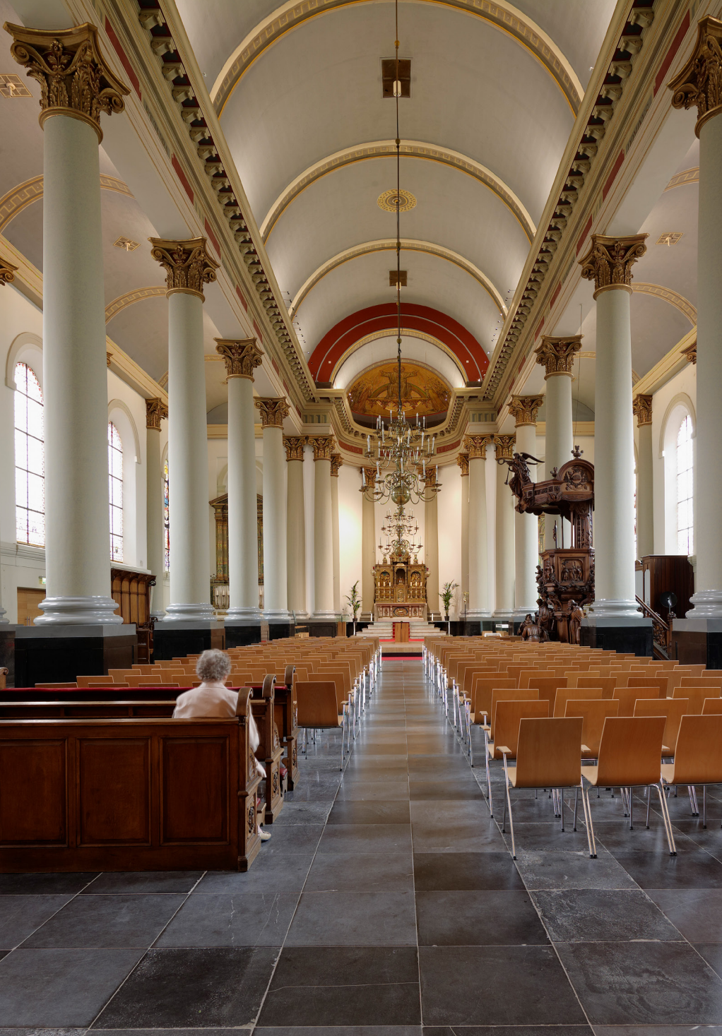
De Antonius van Paduakerk in Breda, kathedraal van het gelijknamige bisdom, is met zijn pilaren, kapitelen, tongewelf en kroonlijsten een beeldmerk van een waterstaatskerk.