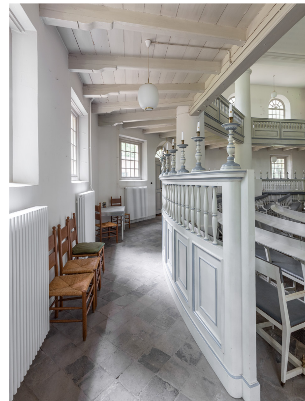
Achter de banken en onder de galerijen bevindt zich een omgang, afgescheiden van de kerkzaal door een hekwerk met daarop balusterkandelaars.