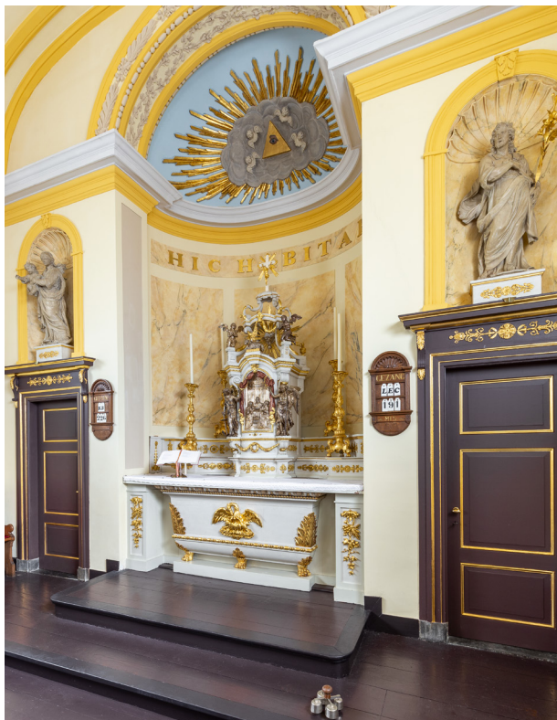
Het hoofdaltaar is grotendeels gemaakt van wit geschilderd hout met vergulde decoraties. Links en rechts boven de deuren zeventiende-eeuwse beelden van Jozef en Maria met Kind, toegeschreven aan Artus Quellinus.

siervelden. Verfijnd vormgegeven decoratie verlevendigt de randen en lijsten van het plafond. Eveneens karakteristiek is de altaarnis met flankerende sacristie-ingangen met deuromlijstingen. In menige oudkatholieke (en roomse) waterstaatskerk komt zo'n opzet voor, vaak nog terug te voeren op de inrichting van de schuilkerk. In de kerk van Maria Maior bevinden zich boven die ingangen nissen met fraaie beelden van Maria en Jozef, afkomstig uit de 'Maria op de Kamp'