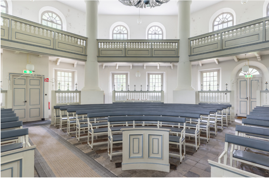
Rondom de preekstoel staan rechte en gebogen banken opgesteld. De witte beschikking met blauwgrijze accenten is ook hier doorgevoerd. Goed zichtbaar zijn hier ook de twee boven elkaar geplaatste rijen met vensters: onder en boven de galerijen.