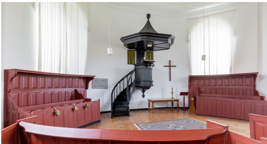
Het meubilair in protestantse waterstaatskerken is vaak vervaardigd in beschilderd naaldhout, zoals hier in de protestantse kerk van het Groningse Nieuw-Beerta.

‘Menige katholieke waterstaatskerk werd door een neogotische opvolger vervangen’