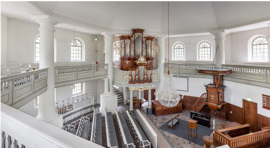
Zicht vanaf de galerij. Bovenin de grote, gestucte koepel die gedragen wordt door grote zuilen.