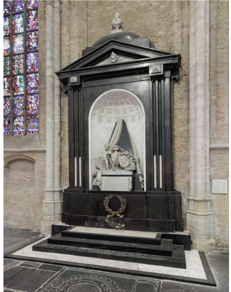
Het grafmonument voor Hugoni Grotio, ofwel Hugo de Groot in de Nieuwe Kerk in Delft. Het witmarmeren beeldhouwwerk toont onder andere een gelauwerde schedel, een medaillon met een portret van De Groot en een putto met wapenschild en loftrampet.

le belichaming van de staatkundige geschiedenis van Nederland irrelevant. Door de achtereenvolgende overname van de afzonderlijke ‘Nederlandse’ territoria door de ‘buitenlandse’ Bourgondisch-Habsburgse dynastie in de vijftiende en eerste helft van de zestiende eeuw resideerde uiteindelijk nergens de landsheer nog in de Nederlanden zelf. Kort na de Opstand veranderde dat door de opkomst van een nieuwe dynastie, namelijk een stadhouderlijke: de Hollandse Oranjes in de meeste gewesten, en de Friese Nassaus in Leeuwarden. Voor de baronie van Breda, waar de Nassaus al eerder voet aan de grond hadden gekregen, had de Onze-Lieve-Vrouwekerk in katholieke tijden als mausoleum voor de Nassaus gediend. Een reeks praalgraven van de late veertiende tot de vroege zestiende eeuw getuigt hier nog van. Op het cruciale moment dat Willem van Oranje in Delft werd vermoord (1584), verhinderde de Spaanse bezetting