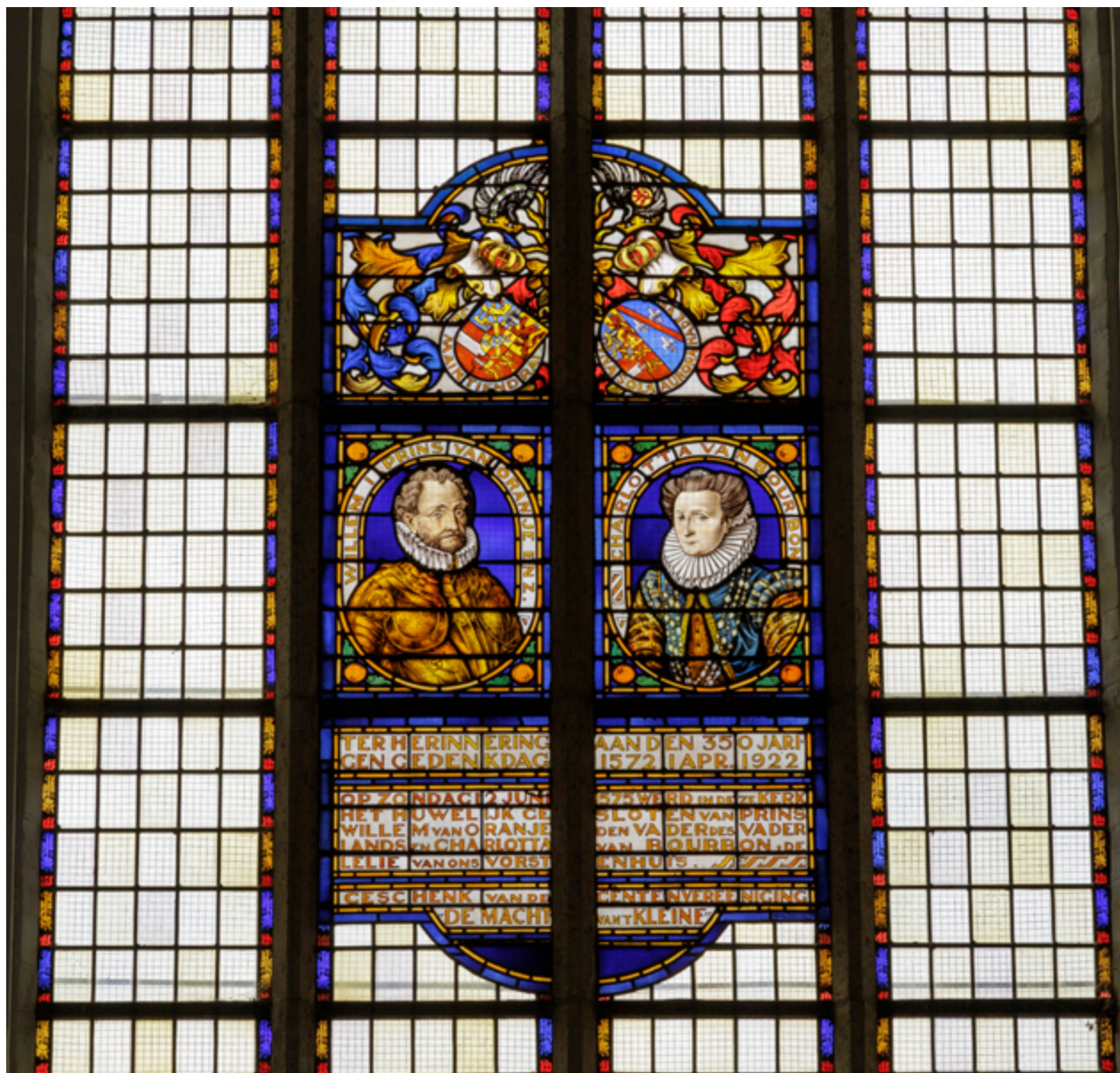
In de twintigste eeuw werden vier ramen in de kerk geplaatst die herinneren aan belangrijke Brielse gebeurtenissen uit de zestiende eeuw. Het Oranjeram uit 1922 memoreert de huwelijksvoltrekking tussen Willem van Oranje en Charlotte de Bourbon, die hier liefkozend de 'lilie van ons vorstenhuis' wordt genoemd.