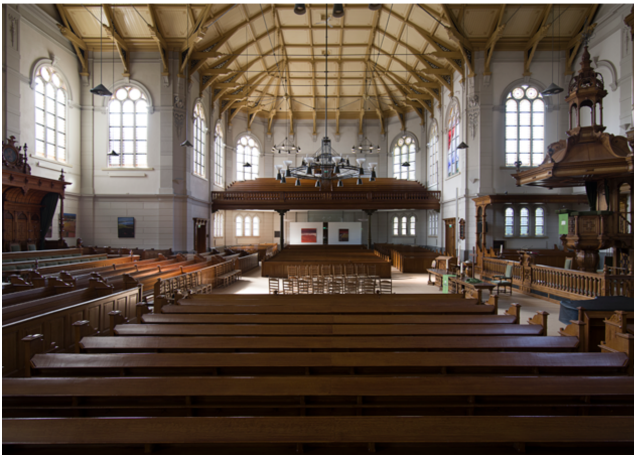
Het interieur van de kerk kenmerkt zich door een inrichting met vele bankenblokken gericht op het open midden tussen de preekstoel en de overhulde bank van de koninklijke familie.

1840-1842 uitgevoerde ontwerp voorzag in een driebeukige neoclassicistische kruiskerk zonder galerijen. In de ondiepe dwarsarmen waren tegenover elkaar de preekstoel en de hofbanken geplaatst, die aan maar liefst 74 personen ruimte boden; in de desbetreffende dwarsarm bevond zich de aparte koninklijke ingang van het gebouw. 7