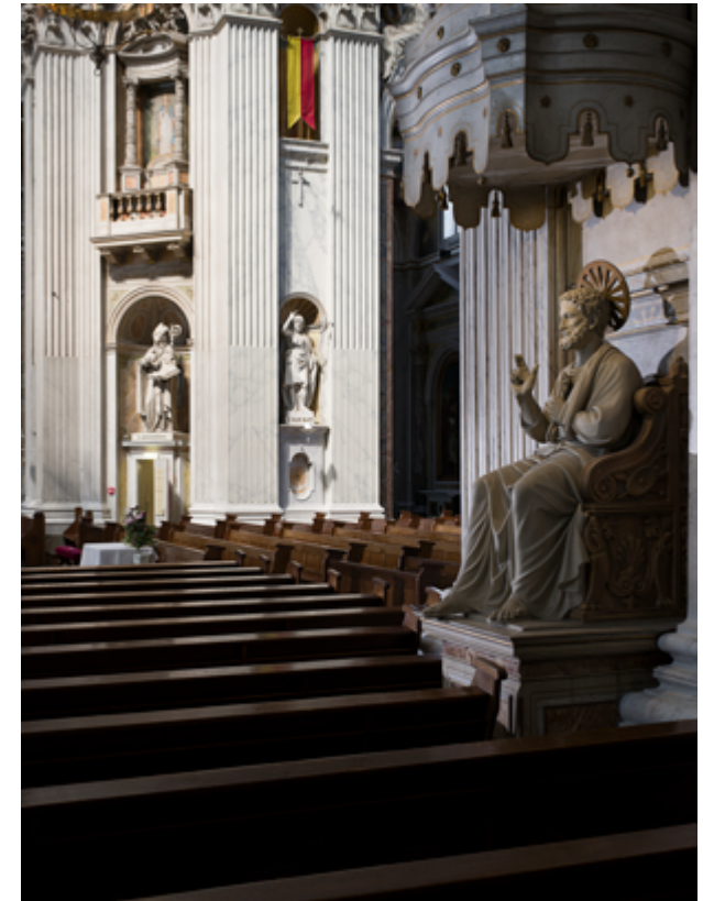
Zelfs het beroemde beeld van de heilige Petrus, de belangrijkste apostel en patroonheilige van de Sint-Pieter, is in Oudenbosch gekopieerd.

Ooit was ook een plaquette ter herinnering van de zoeaven gepland, maar uiteindelijk koos men voor een monument vóór de kerk, in 1911 onthuld. Het is vervaardigd door de Haagse beeldhouwer Leo Stracké (1851-1923) en toont Pius IX die een stervende zoeaaf zegent.