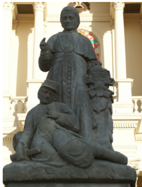
De zoeaven, die tussen 1864 en 1870 streden voor behoud van de Kerkelijke Staat, worden geëerd met een monument op het voorplein van de basiliek in Oudenbosch. Het beeld van de hand van Leo Stracké toont paus Pius IX die een stervende zoeaaf zegent.

God, Vaderland en Oranje: geen type gebouw was uiteraard geschikter om deze heilige nationale drie-eenheid artistiek tot uitdrukking te brengen dan een kerk. Dit vertaalde zich onder meer in kleinere of grotere cycli van gebrandschilderde ramen die het koningshuis verheerlijkten, zoals het Kroningsraam (1898) in de zuidtranseptgevel van de Amsterdamse Nieuwe Kerk, later nog met een paar andere Oranjeglazen aangevuld. Een belangrijke reeks werd tussen 1923 en 1936 in de Nieuwe Kerk in Delft aangebracht. Daarvan maakte overigens ook, als tegenhanger van het Wilhelminavenster in het zuidtransept, in het noordtransept een enorm gebrandschilderd raam ter ere van Hugo de Groot en zijn familie deel uit, als van een alternatieve staatkundige dynastie.