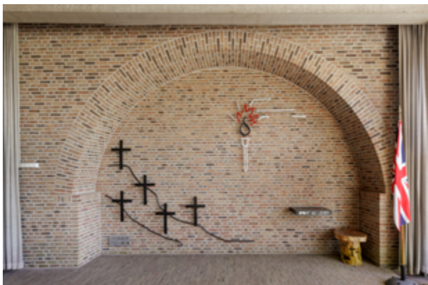
Op de achterwand van de gedachtenishal zijn tegen de contouren van de Grebbeberg vijf kruisen geplaatst (symbool voor vijf dagen strijd, vijf jaren bezetting) en een fakkel van hoop. Rechts een stenen plateau voor een gedenkboek met de namen van de gevallen op de Grebbeberg.