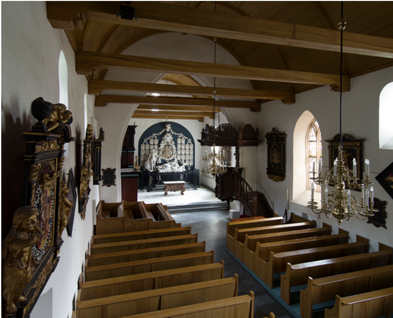
Het rijke interieur van de kerk toont de invloed van de adellijke familie van de nabij gelegen borg Nienoord, die sterk haar stempel drukte op de inrichting en aankleding van dit bedehuis.