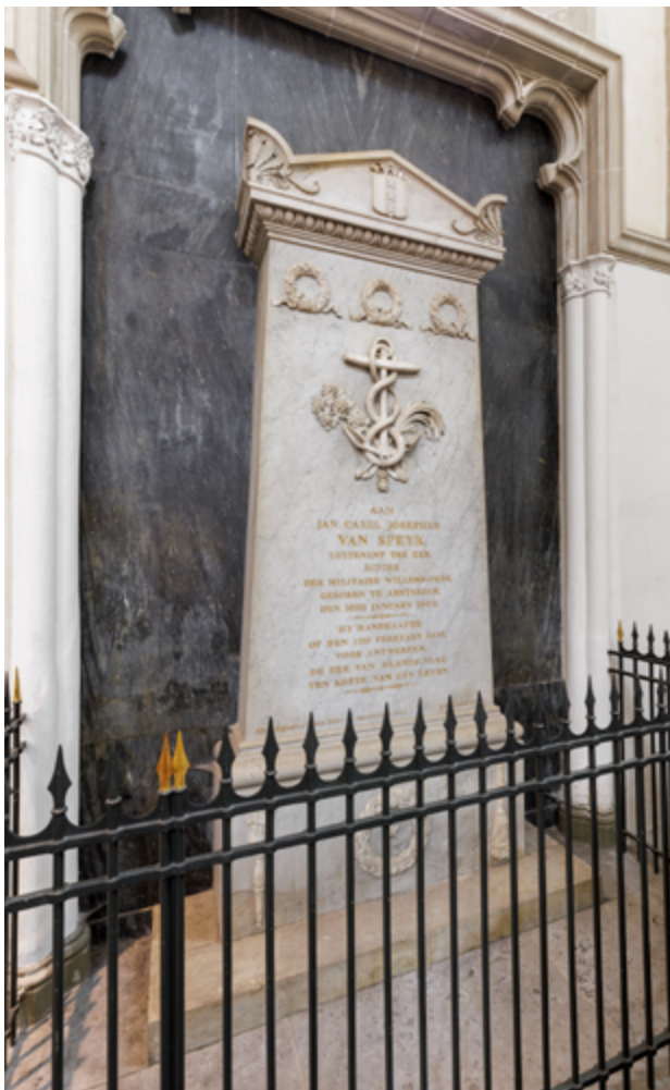
Ook luitenant-ter-zee Jan van Speijk werd begraven in de Amsterdamsche kerk. Hij verwierf roem tijdens de Belgische Opstand door zijn kanonneerboot te laten exploderen, zodat die niet in vijandelijke handen kon vallen. Het monument vermeldt: 'Hy handhaafde de eer van 's lands vlag, ten koste van zyn leven'.

kort voor zijn dood in Napels 26 Hongaarse predikanten had bevrijd.