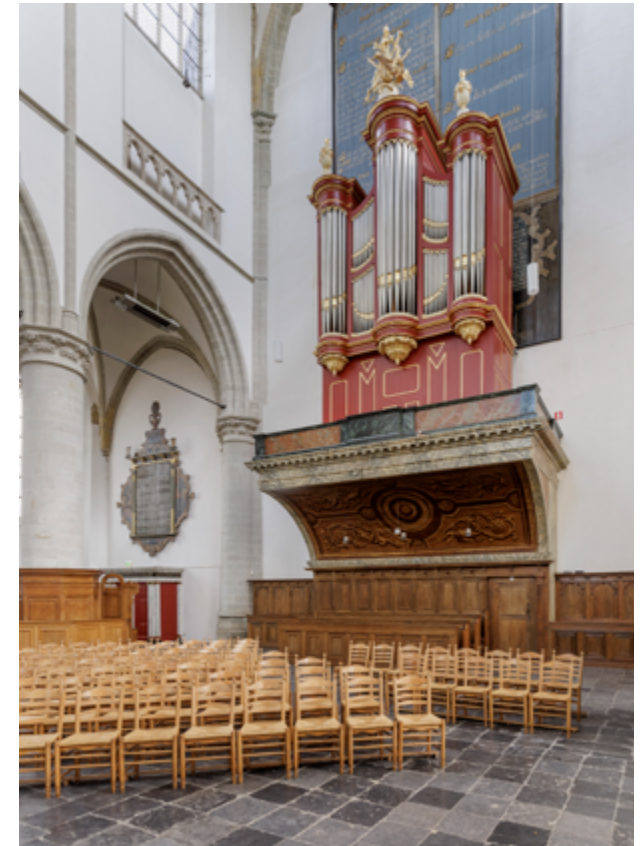
Onder het orgel aan de oostzijde staat een speciaal gestoelte met luifel voor officieren en kapiteins. De aanwezigheid van deze bank verhaalt over Brielle als garnizoensplaats.