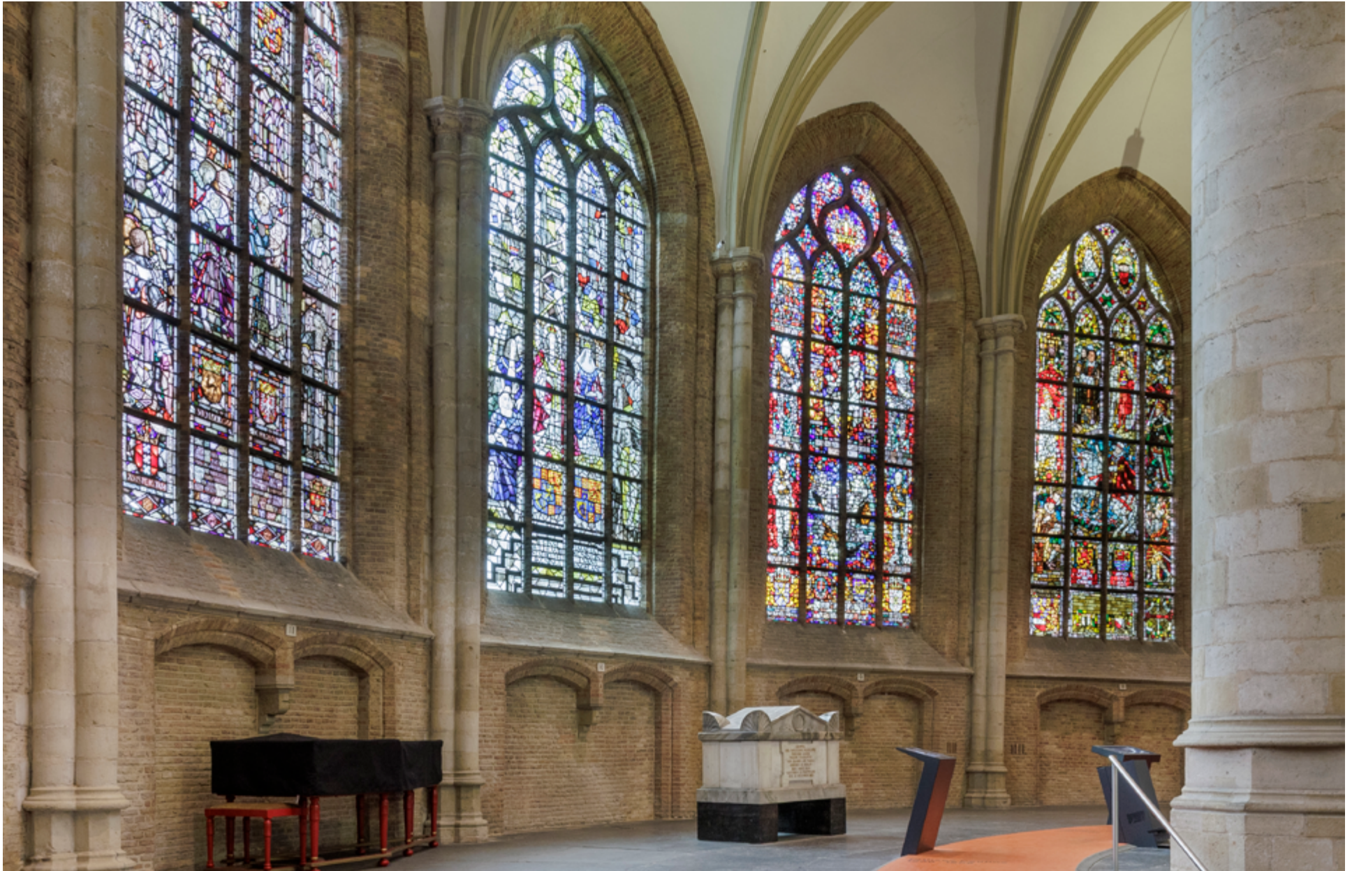
Het interieur van deze Delftse kerk met de grafmonumenten en gebrandschilderde ramen is opengesteld als museum.