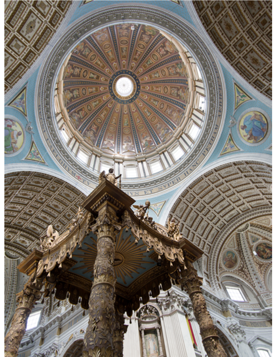
Allerhande onderdelen van de Romeinse kerk zijn als kopie in Oudenbosch te vinden. Dat geldt voor de wereldberoemde Pietà van Michelangelo, maar ook voor het altaarbaldakijn van Bernini dat in Brabant op indrukwekkende wijze werd nageemaakt.