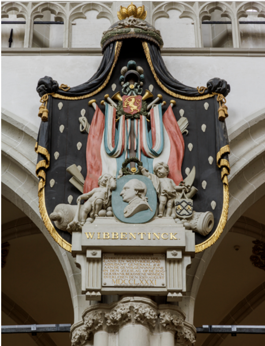
In de traditie van zijn roemruchte voorgangers in de zeventiende eeuw kreeg de zeecommandant Wolter Bentinck een epitaaf in het hoogkoor. Hij overleed in 1781 aan zijn verwondingen opgelopen tijdens de zeeslag bij de Doggersbank. Bentinck kreeg een staatsbegrafenis.