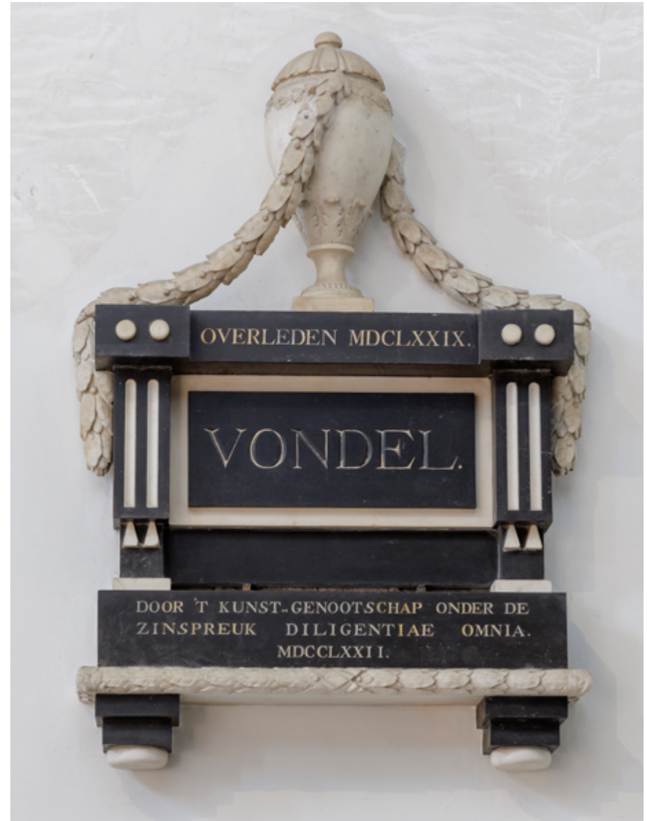
Veel vooraanstaande Amsterdammers vonden in de Nieuwe Kerk in Amsterdam hun laatste rustplaats, onder wie in 1679 Joost van den Vondel. In 1772 werd, op kosten van het kunstgenootschap Diligentiae omnia , een gedenkteken geplaatst ter herinnering aan de befaamde dichter en schrijver.