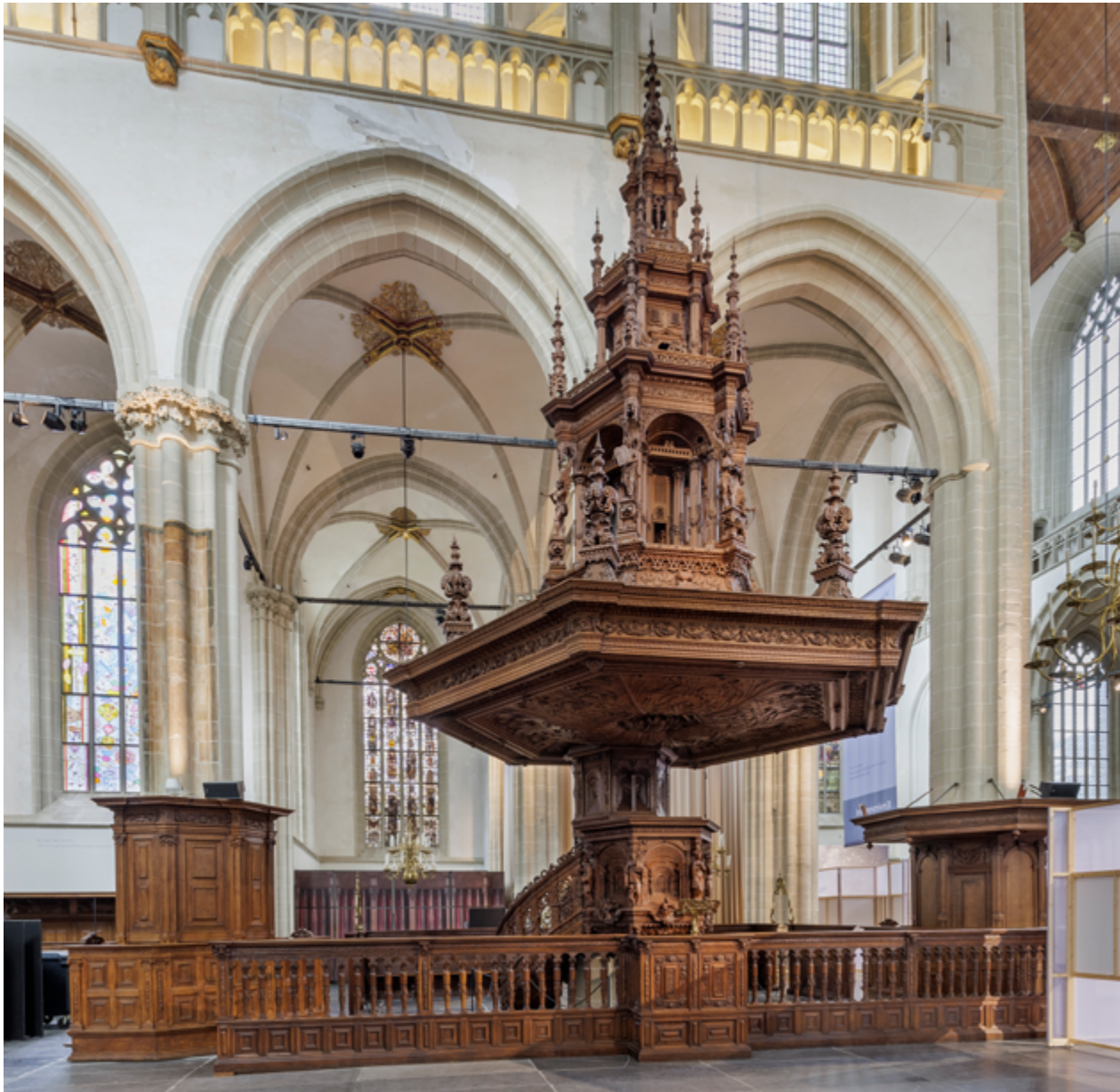
De Nieuwe Kerk bevat meerdere historische lagen. Het zeventiende-eeuwse liturgisch ensemble van preekstoel, doophek en bijhorend koperwerk bleef bewaard en is een blikvanger in het interieur.

enigszins hardhandige reiniging van het interieur van altaren, beelden en andere paapse parafernalia kregen enkele voor de nieuwe protestantse eredienst overbodig geworden ruimtes een profane bestemming. Van de overtollig geworden straalkapellen gingen er enkele als rommelhok, timmerwerkplaats, kolenhok en kookhoek van de koster dienen. In twee kapellen aan de noordelijke kooromgang vond voortaan de bedeling van de armen plaats; in 1642 werd direct aan de buitenzijde tegen deze kapellen een aparte diaconie gebouwd. In het hoogkoor werden nu regelmatig huwelijken voltrokken; ook werd het tweemaal per jaar voor prijsuitreikingen van de Latijnse scholen benut. Na de brand van 1645, die niet meer dan de buitenmuren overeind liet, werd de herbouw van de kerk onderdeel van een grootschalige upgrade van het hart van de stad, die tot veruit de belangrijkste van de Republiek was uitgegroeid. Omwille van het enorme nieuwe classicistische stadhuis (1648-1664) van Jacob van Campen (1596-1657) werden enige huizenblokken afgebroken. Daardoor kwam de Nieuwe Kerk aan de Dam te liggen, wat een opwaardering van het zuidelijke transeptportaal tot hoofdingang met zich meebracht.