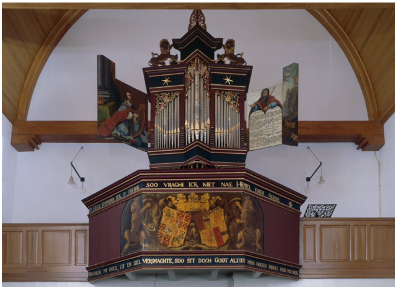
Ook op de orgelgalerij lieten de adellijke schenkers zich gelden. De familiewapens werden goed zichtbaar afgebeeld, pal onder de beschildeerde orgelluiken met koning David en Mozes met de tien geboden.

Zulke merktekens van beide geslachten keren ook elders in de kerk veelvuldig terug. De uitzonderlijk hoge familiebank (1660), met de zitplaatsen van het huispersoneel eronder, is met beide familiewapens gedecoreerd. Het orgel gaat in de kern terug tot een huisorsgel van Nienoord; bij de installatie in de kerk