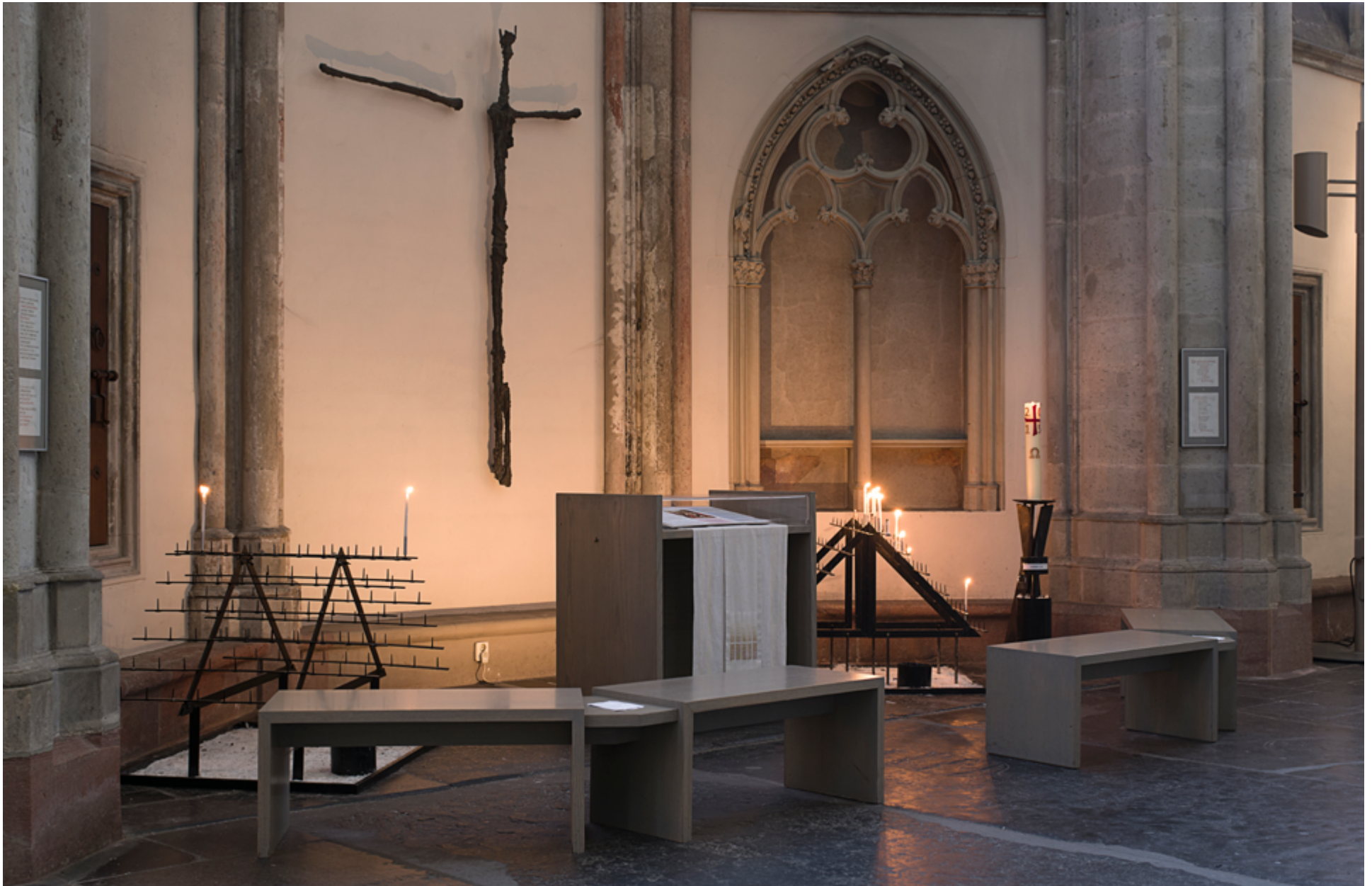
De voormalige Heilig Kruiskapel is ingericht als gedachteniskapel. Bij het bronzen – gebroken – kruis van Carel Kneulman kunnen bezoekers een kaarsje branden.