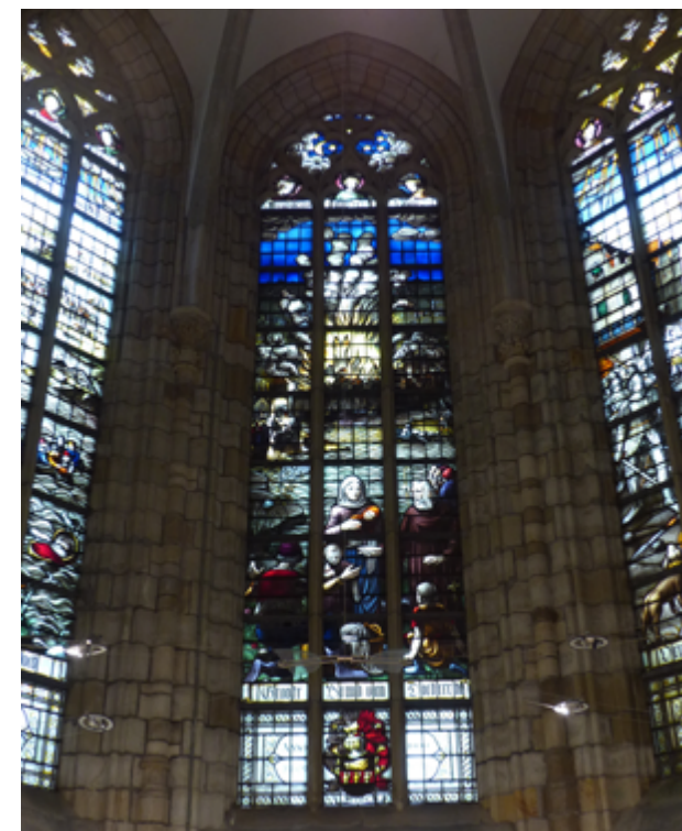
Aan het begin van de twintigste eeuw schonk de familie Stoop drie glas-in-loodramen met episodes uit de geschiedenis van de stad Dordrecht. Het middelste raam toont de grote stadsbrand van 1457, waarbij de voorganger van de Grote Kerk in vlammen opging.