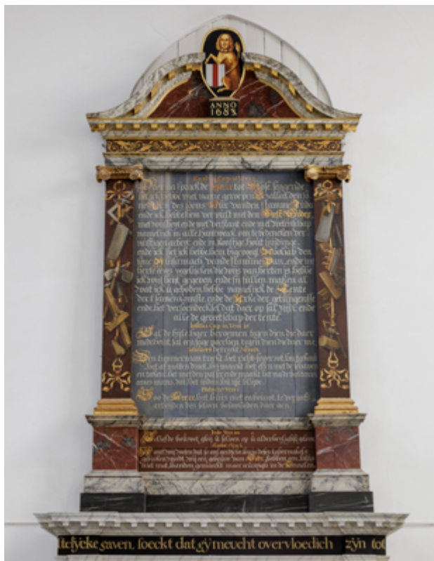
In de kerk hangt een drietal grote gildeborden. Het bord van het gilde van de timmerlieden uit 1683 bevat verschillende Bijbelteksten over bouwen en timmeren en toont timmegerieedschap langs de randen.

de schutterskapitein die in 1831 de Brielse schutterij tegen de opstandige Belgen moest aanvoeren. Het militaire en maritieme karakter van garnizoensplaats Brielle kwam in het kerkinterieur tot uitdrukking in de speciale banken voor hoge officieren en Schotse zeekapiteins onder het orgel, waarvan de luifel met een Tudorroos is beschilderd. De voornaamste zitplaatsen, dwars tegenover de preekstoel, bleven ook hier uiteraard voorbehouden aan de stadsregering.