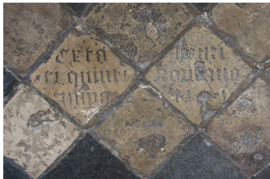
Deze vloertegels met inscriptie in het koor van de Domkerk in Utrecht geven de plaats aan waar hart en ingewanden van de keizers Koenraad II en Hendrik V werden begraven.