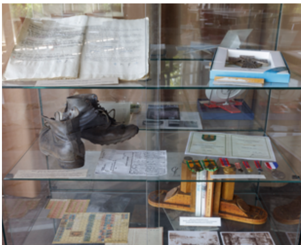
Vitrine in de gedachtenishal waarin voorwerpen van oud-strijders worden getoond.