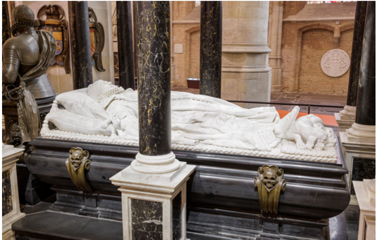
Het grafmonument van Willem van Oranje toont de prins tweemaal; bij leven en als overledene. Achter het bronzen beeld waar hij in volle wapenrusting te zien is, ligt de ingeslapen stadhouder uitgebeeld in witmarmer met aan zijn voeteneind zijn hond als zinnebeeld van trouw.

Het in zwarte, witte en goudgeaderde marmersoorten uitgevoerde mausoleum verrees boven de eveneens nieuw aangelegde grafkelder in het hoogkoor, op de plaats van het voormalige hoofdaltaar, waarbij wel de vloer van het koor verlaagd werd om de ruimte haar katholieke gewijde karakter verder te ontnemen. Vier allegorische vrouwenfiguren verbeelden de deugden van de prins en tevens de idealen van de Republiek. De overledene is tweemaal weergegeven, eenmaal in marmer als zojuist ontslapene op de tombe en eenmaal in brons, zittend in wapenrusting met boven hem zijn familiewapen. Aan de overzijde, bij het voeteneinde van de overledene, verrijst de vliegende Faam, een technisch hoogstandje, dat tijdens het construeren overigens een paar maal was omgevallen en vanwege het steeds noodzakelijke herstel de oorspronkelijke kosten van 28.000 gulden fors vermeerderd heeft. Na Willem van Oranje zouden in de grafkelder ook alle latere stadhouders van Holland begraven worden, uitgezonderd Willem III (1702 in Westminster) en Willem V (1806 in Braunschweig, in 1958 alsnog in Delft bijgezet). De al in 1752 aangelegde tweede grafkelder werd in 1822 fors uitgebreid. Hier hebben sindsdien alle drie koningen en drie koninginnen, hun echtgenoten en veel andere familieleden hun laatste rustplaats gevonden, 43 personen in totaal.