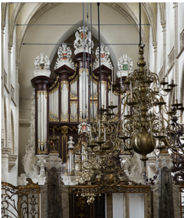
Het uit 1671-1672 stammende orgel aan de westkant bij het torenportaal wordt gesierd door het Hollandse wapen (midden) en de wapens van de vier toenmalige kerkmeesters.

Aan het eind van de achttiende eeuw moet de Grote Kerk ver boven de honderd wapenschilden hebben geteld. Het was een dusdanig groot aantal, dat het aanbrengen van wapenschilden in 1765 expliciet verboden moest worden, zodat het zicht op het orgel niet