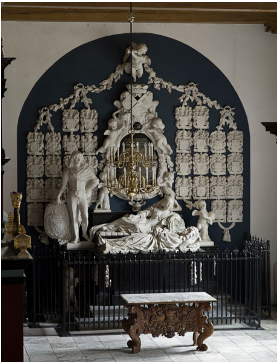
Het praalgraf van het geslacht Von Inn- und Kniphausen domineert het interieur van de Adelskerk in het Groningse Midwolde

van Breda evenwel continuering van deze familietraditie. In Delft ging nu in de Nieuwe Kerk een nieuwe traditie van start, met de bouw (1614-1623) in het koor van het meest pompeuze mausoleum uit de tijd van de Republiek, van de hand van Hendrick de Keyser (1565-1621). De meeste stadhouders werden er nadien begraven, en na het herstel van de Nederlandse onafhankelijkheid in 1813 ook alle gekroonde monarchen. Sindsdien is de Delftse Nieuwe Kerk nauw verbonden met het Nederlandse koningshuis, ook al zou juist in dit kerkgebouw evenzeer ruimte blijken te zijn voor een verering van een van hun belangrijkste tegenstrevers uit de zeventiende eeuw, de daar eveneens begraven staatsrechtgeleerde Hugo de Groot (1583-1645).