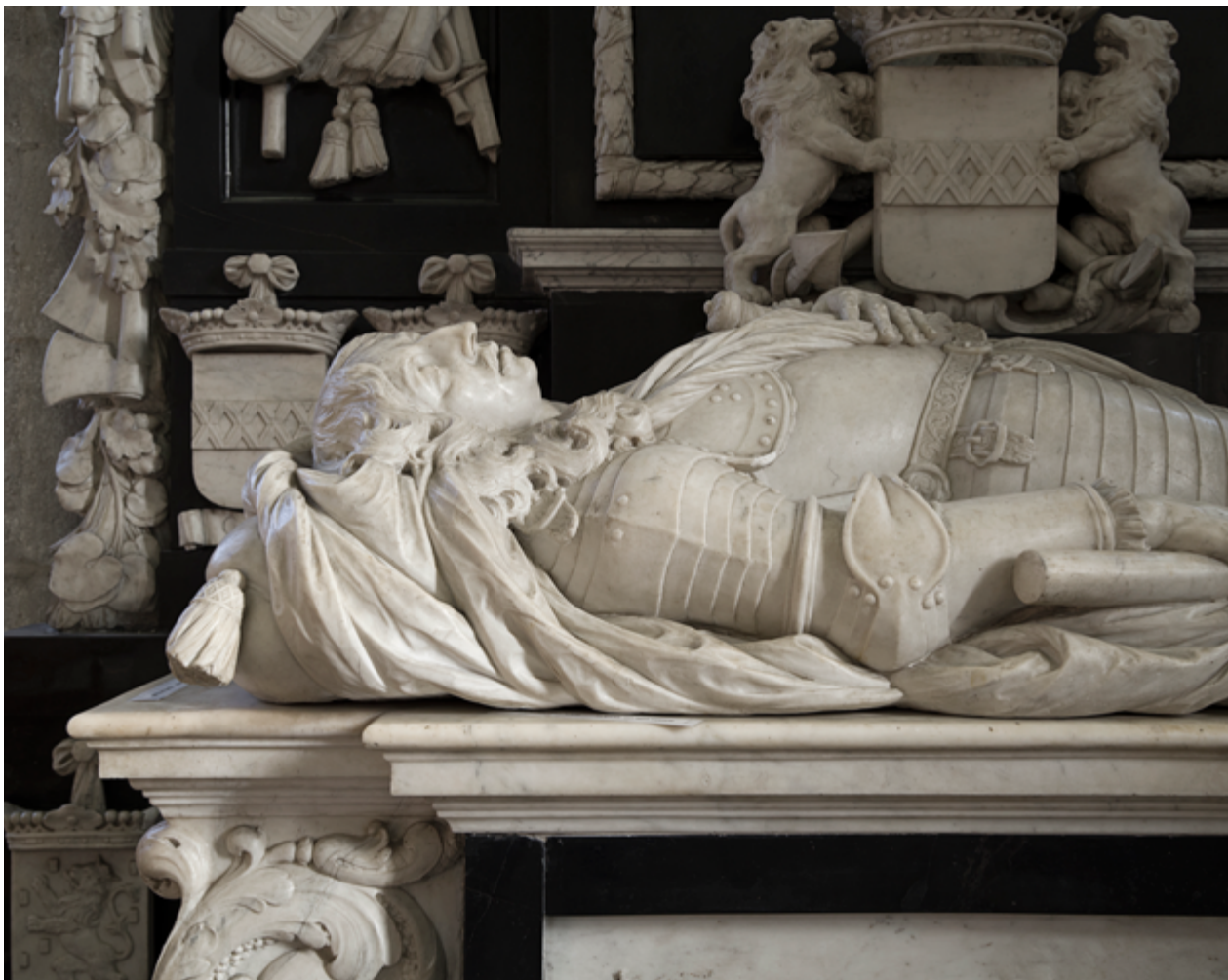
Het marmeren praalgraf voor Willem Joseph van Gendt werd in 1674-1676 vervaardigd door Rombout Verhulst in opdracht van de admiraliteit van Amsterdam.

twee steentjes aangegeven, die met de tweekoppige rijksadelaar zijn gesierd. Zij herinneren aan de nauwe band tussen de Salische keizerdynastie en het vorstbisdome Utrecht, en aan de belangrijke positie die dit binnen