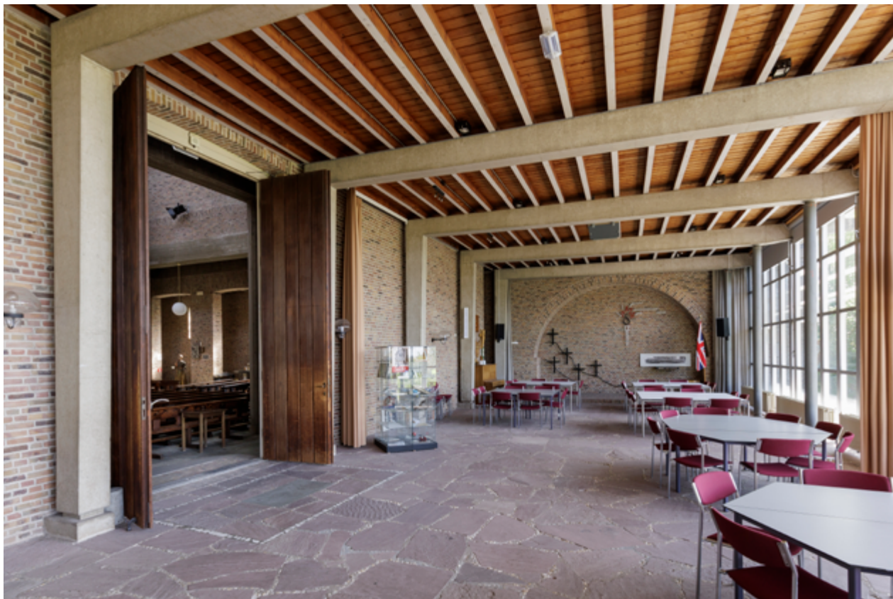
De ruime gedachtenishal werd gebouwd ter nagedachtenis aan de slachtoffers van de Tweede Wereldoorlog. De hal heeft een prachtig uitzicht over de Nederrijn. Achter de vier meter hoge deuren (symbool voor de hemelpoort) ligt de kerkzaal.