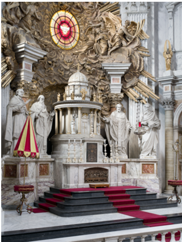
De sluitwand van het koor heeft eenzelfde raam en engelandecoratie als de Sint-Pieter. Het marmeren altaar wordt geflankeerd door beelden van verschillende kerkvaders.