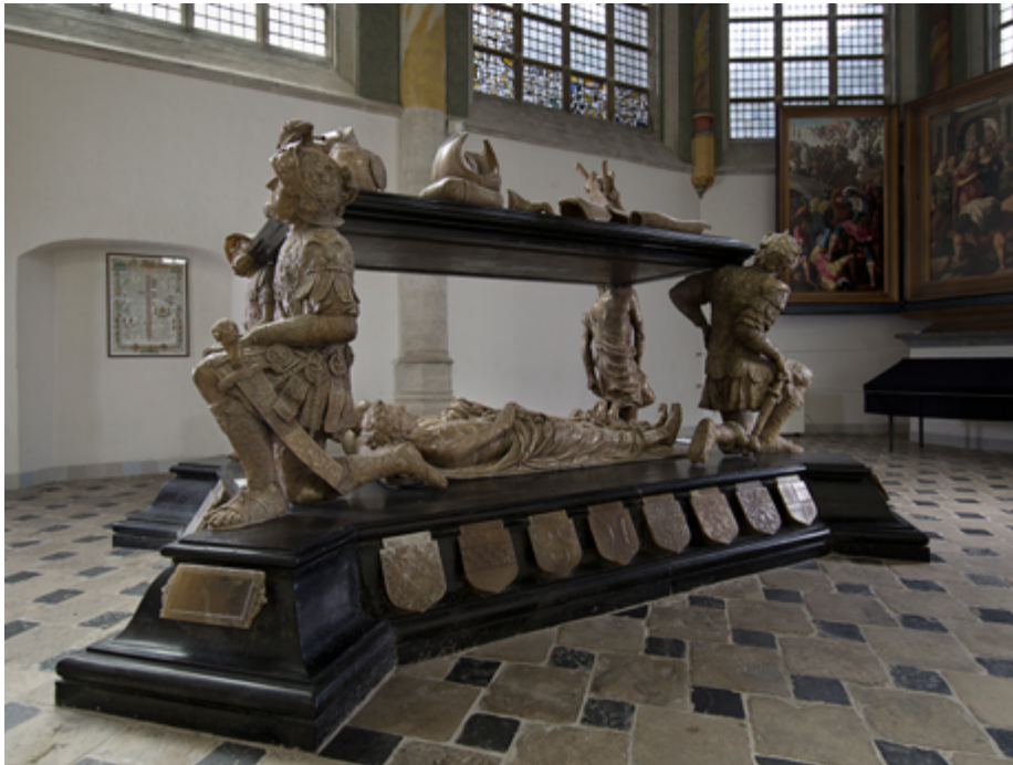
De Onze-Lieve-Vrouwekerk in Breda was vóór de Reformatie de grafkerk voor de Nassaus. Het praalgraf voor Engelbrecht II, graaf van Nassau en Cimburga van Baden uit 1534 is een van de topstukken.

le belichaming van de staatkundige geschiedenis van Nederland irrelevant. Door de achtereenvolgende overname van de afzonderlijke ‘Nederlandse’ territoria door de ‘buitenlandse’ Bourgondisch-Habsburgse dynastie in de vijftiende en eerste helft van de zestiende eeuw resideerde uiteindelijk nergens de landsheer nog in de Nederlanden zelf. Kort na de Opstand veranderde dat door de opkomst van een nieuwe dynastie, namelijk een stadhouderlijke: de Hollandse Oranjes in de meeste gewesten, en de Friese Nassaus in Leeuwarden. Voor de baronie van Breda, waar de Nassaus al eerder voet aan de grond hadden gekregen, had de Onze-Lieve-Vrouwekerk in katholieke tijden als mausoleum voor de Nassaus gediend. Een reeks praalgraven van de late veertiende tot de vroege zestiende eeuw getuigt hier nog van. Op het cruciale moment dat Willem van Oranje in Delft werd vermoord (1584), verhinderde de Spaanse bezetting