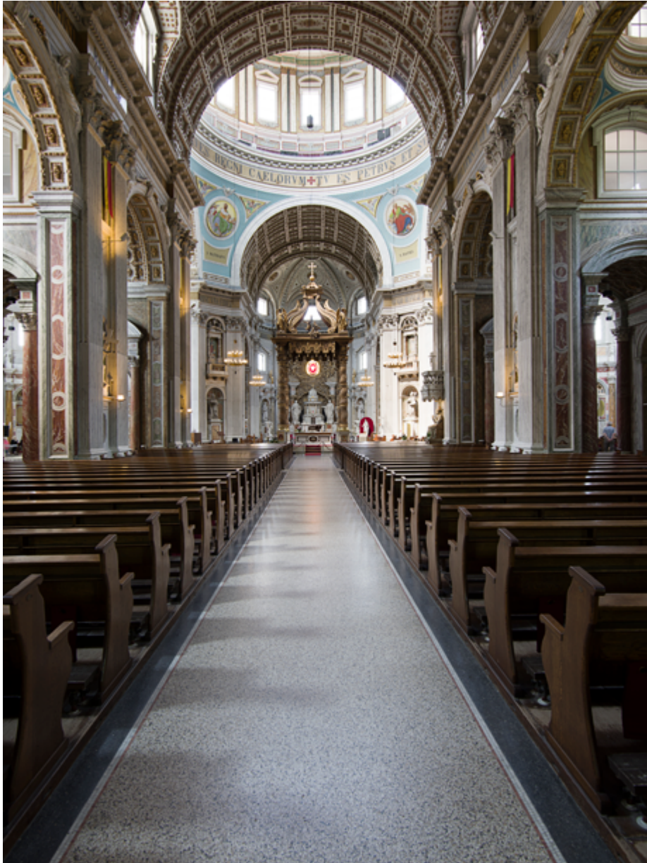
Hoewel het om een verkleinde kopie van de Sint-Pieter in Rome gaat is de basiliek van Oudenbosch een immens gebouw met een heldere as en een duidelijke focus op het sacramentsaltaar.