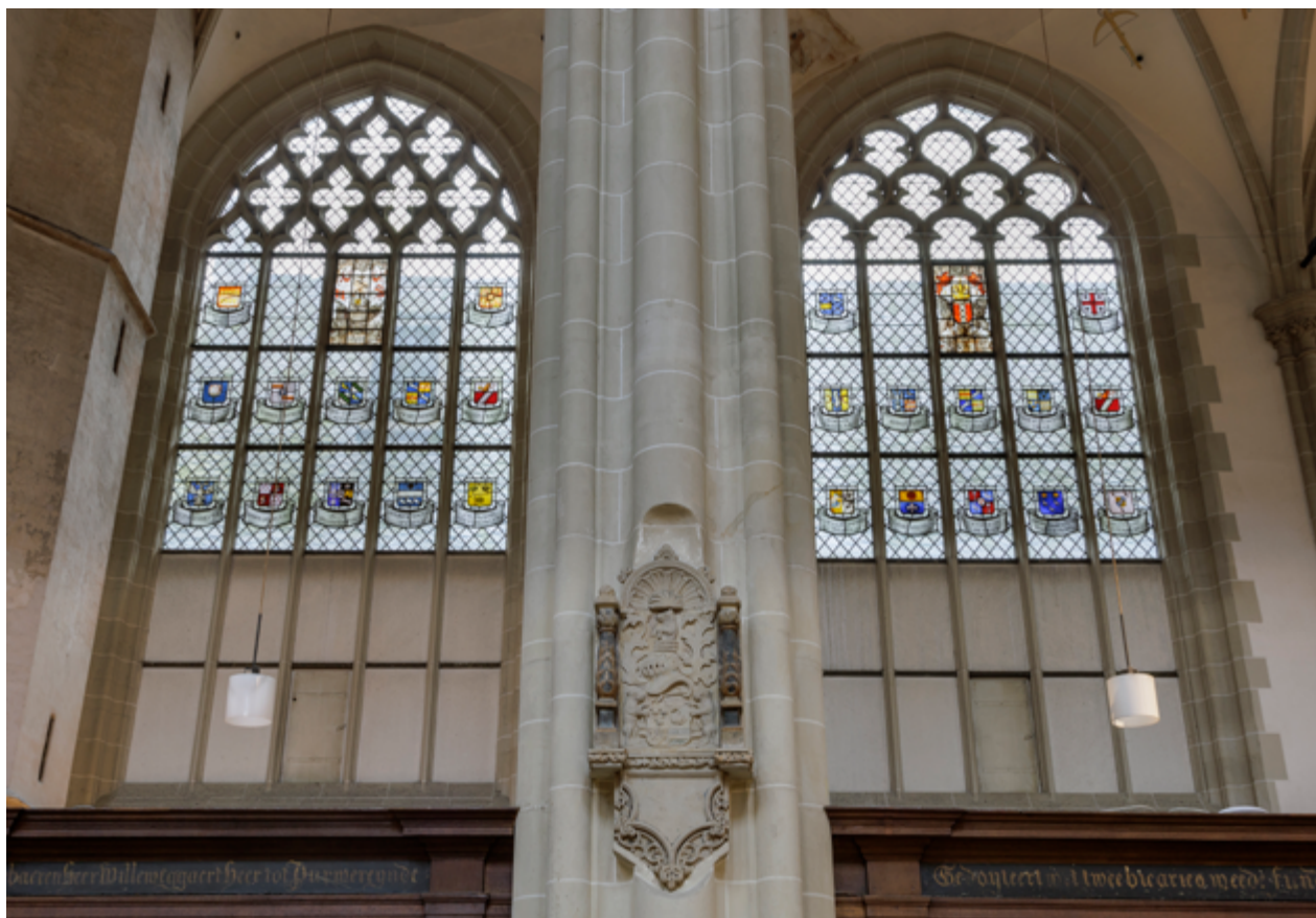
De stadsmagistraat en de Amsterdamse gilden en vroedschappen drukten hun stempel op de uitmonstering van de kerk in de zeventiende eeuw. In de zijkapellen bevinden zich gebrandschilderde glazen met diverse familiewapens van vroedschapsleden.

Dat in de Nieuwe Kerk veel vooraanstaande Amsterdammers hun laatste rustplaats vonden, spreekt van zelf; onder hen naast Joost van den Vondel (1587-1679) ook raadpensionaris Rutger Jan Schimmelpenninck (1761-1825). Hier begint de tweede historische laag chronologisch te overlappen met de derde: die van een soort nationale (graf)kerk van de Republiek. Deze laag komt vooral tot uiting in praalgraven voor gesneuvelde zeehelden. Op het eerste praalgraf voor Jan van Galen (1604-1653) in een noorderzijkapel volgde al snel het belangrijkste: dat voor Michiel de Ruyter (1607-1676), van de hand van Rombout Verhulst. Daarvoor werd het hele achtereinde van het