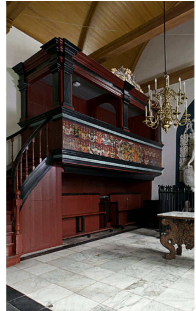
Het koor van de kerk was het domein van de familie Von Inn- und Kniphausen. Zij had een eigen entree met daarnaast de trapgang tot de hoge loge met zitplaatsen voor de familie. Onder de met wapenschilden beschilderde bank was plaats voor het personeel.