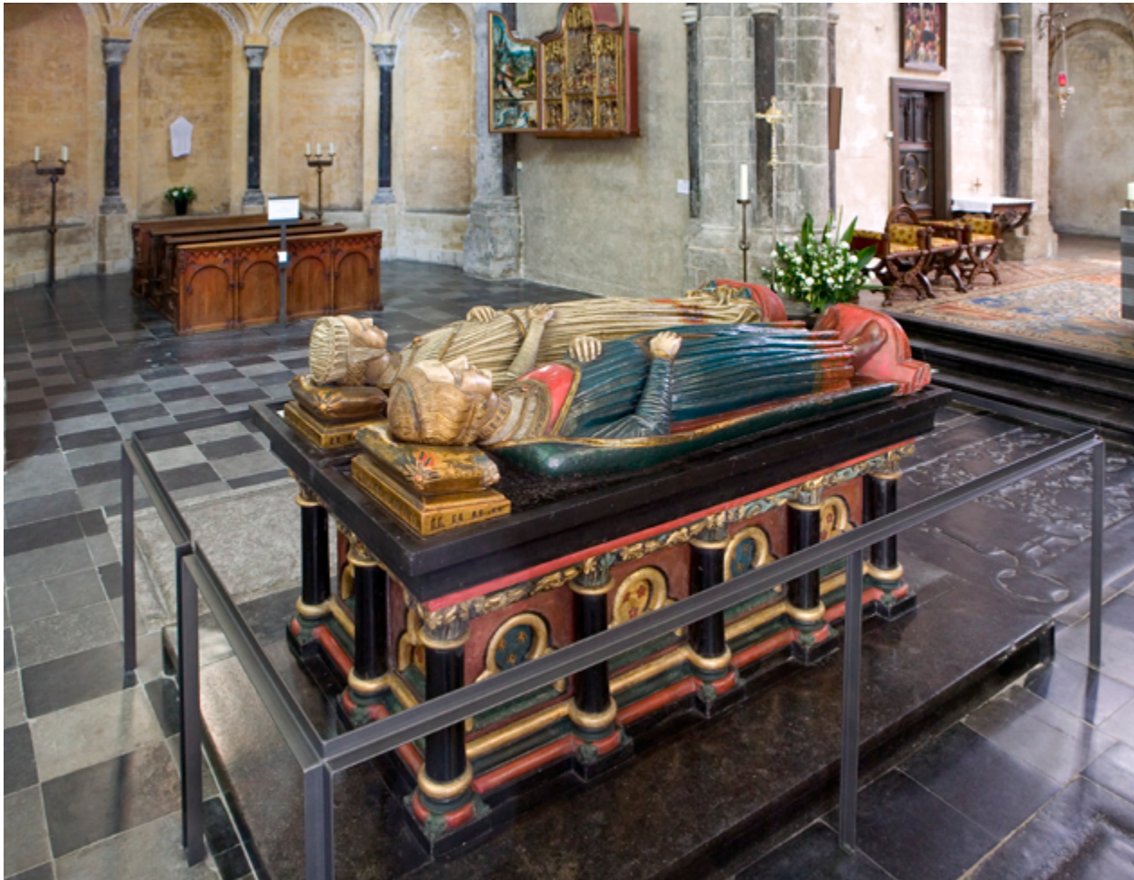
Op het praalgraf onder de vieringkoepel liggen de gisanten van de graaf en zijn echtgenote. Een dergelijk vroeg dubbelgraf van een adellijk echtpaar is zeldzaam en in Nederland uniek.

naar het Duitse Rijnland gekeken; de klaverbladvormige opzet van de oostpartij toont grote verwantschap met enkele romaanse kerken in Keulen. Pal in het midden onder de viering, op het snijpunt van hoofdas en dwarsas, bevindt zich boven de grafkelder het