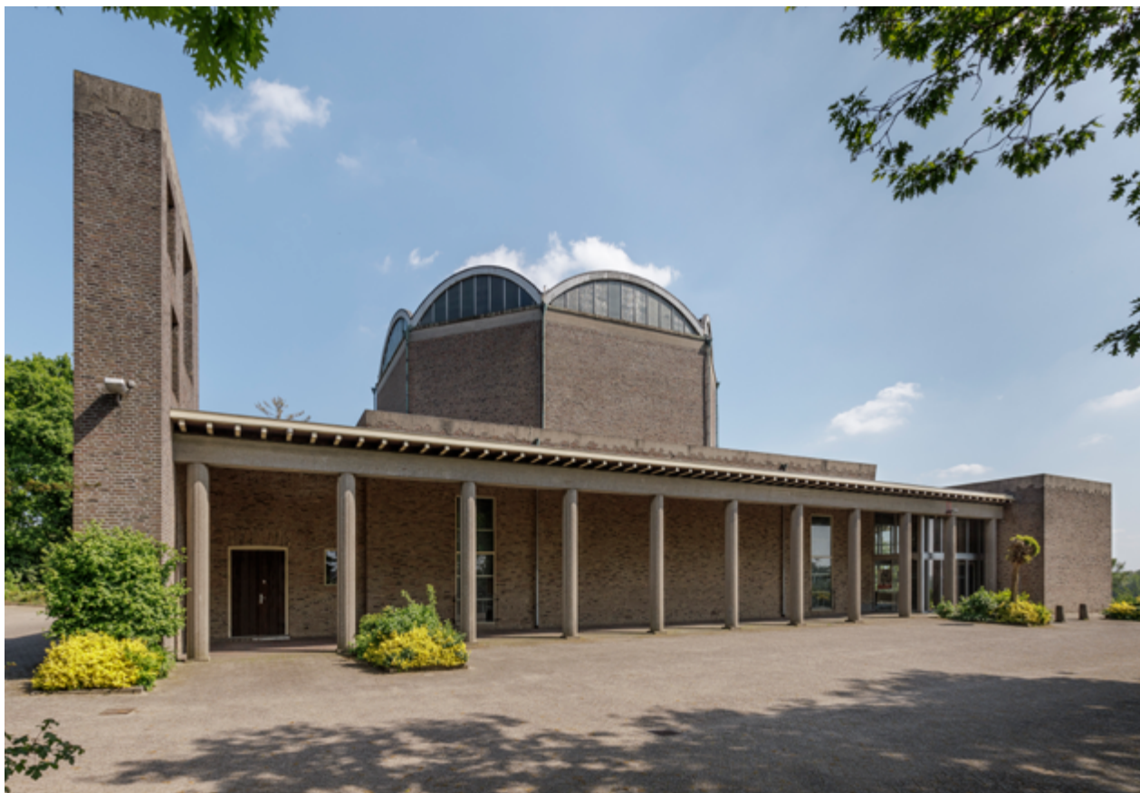
Zicht op de Gedachteniskerk vanuit het westen. Aan deze zijde is de kerk voorzien van een betonnen portico. Centraal de achzijdige middenpartij waarop de betonnen schaalgewelven rusten.

oud-strijders uitgesteld. Ten slotte werd een levensgroot beeld van de heilige Cunera neergezet, volgens de overlevering uit het koper van granaathulzen vervaardigd.