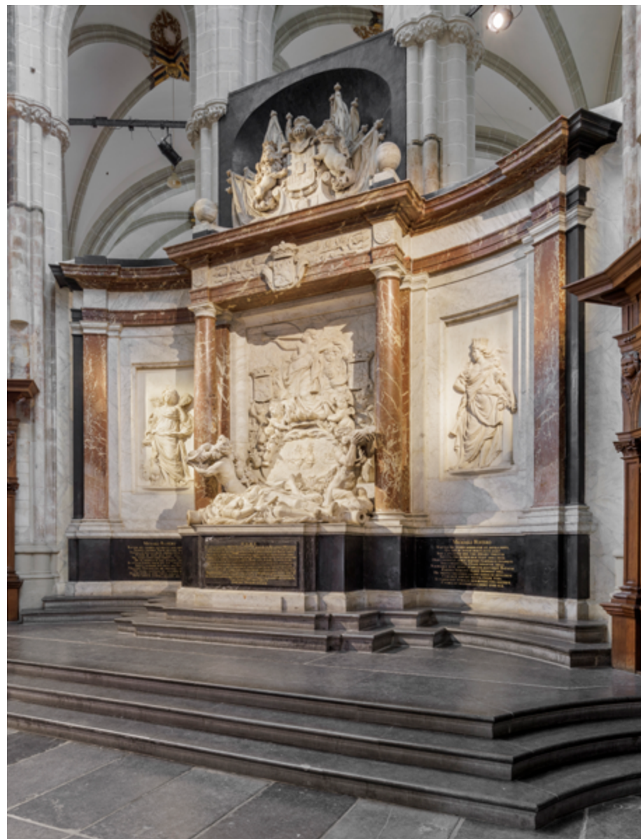
Beeldhouwer Rombout Verhulst maakte in 1681 in opdracht van de Staten-Generaal het prestigieuze grafmonument voor Michiel de Ruyter voor de Nieuwe Kerk in Amsterdam. De symboliek van het praalgraf verwijst naar zijn maritieme heldendaden .

Opvallend genoeg vormen de praalgraven ten tijde van de Republiek net als in de