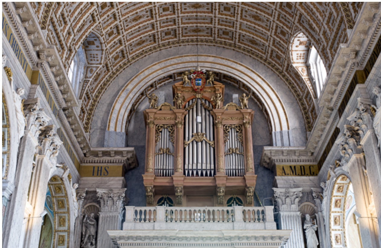
Op de orgelbalustrade boven de toegang van de kerk bevindt zich het orgel, uitgevoerd in Italiaans aandoende renaissancestijlen. Vier putti met muziekinstrumenten sieren de bovenkant van de kas, samen met het wapen van Leo XIII, paus ten tijde van de inwijding van de kerk.

uitzonderlijke politieke ultramontanisme zich bij Hellemons vertaalde in een voor Nederland wél uitzonderlijk artistiek ultramontanisme. Hellemons moest niets hebben van de inmiddels dominante neogotiek: hij voelde zich ook in cultureel opzicht Romein en heeft in de halve eeuw dat hij in Oudenbosch werkzaam was, het Brabantse dorp in een klein Rome trachten te herscheppen. De institutionele kant daarvan leidde tot grote spanningen