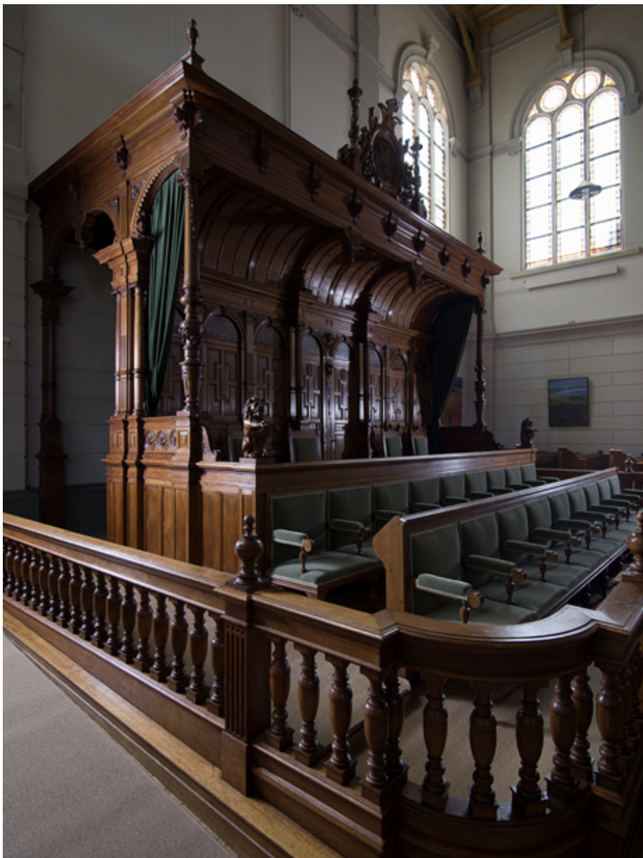
De Grote Kerk van Apeldoorn werd in 1891 gebouwd als hofkerk voor de Oranjes. De rijk gedecoreerde koninginnebank, de familiebank van het koningshuis, staat dan ook recht tegenover de preekstoel.

climax bereikte met de inhuldiging van Wilhelmina in 1898, toen een hele tropische palmentuin werd ingevlogen. Alleen waren al deze constructies slechts van tijdelijke aard, en werden zij na afloop direct weer opgeruimd. 4 Anders was dat bij de Grote Kerk van Apeldoorn, die in 1891 als hofkerk voor paleis Het Loo werd gebouwd, en in de vorm van de koninginnenbank en de plaquettes in de torenhal een duidelijk, blijvend aandenken aan deze functie bezit.